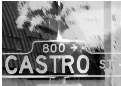
Fotograma de Castro Street (The Coming of Consciousness) , 1966