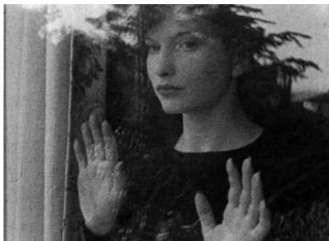
Fotograma de Meshes of the Afternoon , 1943

Joseph Cornell. Thimble Theatre . 1938-1968. 6'07''