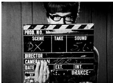
Fotograma de Love It/Leave It , 1970

Lawrence Jordan. Our Lady of the Sphere . 1969. 9'14"