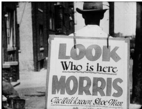
Fotograma de A Bronx Morning , 1931