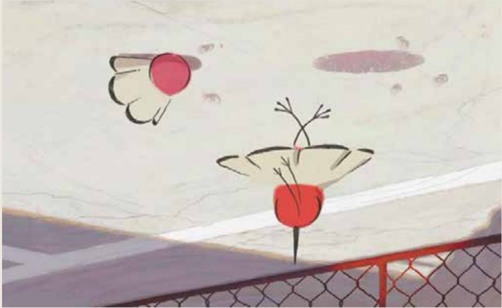
Changeover [Cambio], de Mehdi Alibeygi, Irán, 2014

Museo Nacional Centro de Arte Reina Sofía