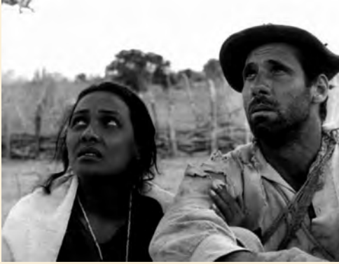
Nelson Pereira dos Santos. Vidas Secas , 1963