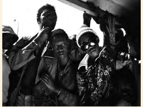
Djibril Diop Mambéty. Touki Bouki , 1973