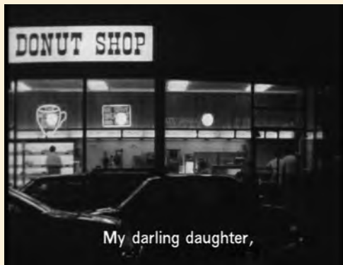
Chantal Akerman. News from Home , 1976

En 1969, los dos directores habían rodado People's War después de un viaje a Vietnam en calidad de miembros de Newsreel, una organización cinematográfica revolucionaria. Más tarde, en Estados Unidos se dedicaron a la propaganda contra la intervención militar americana; en el Estado de Vermont llegaron a crear el grupo Vermont/Vietnam. Sin embargo, la lucha anti-imperialista no llegó a producir un frente de resistencia duradero en Estados Unidos. Milestones es una inmersión y una balada sobre la América de la contracultura en los momentos posteriores a la derrota americana consagrada por el armisticio de enero de 1973. El film es un ensamblaje documental mezclado con secuencias dramáticas; un caleidoscopio de situaciones de vida, acompañadas a menudo de monólogos o largas conversaciones.