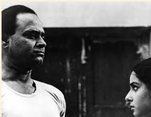
Ritwik Ghatak. Subarnarekha, 1962.

La familia Parondi llega a Milán. Ha abandonado su pueblo de Lucania, en el sur de Italia, tras la muerte del padre, para que los cinco hijos puedan encontrar trabajo en la gran ciudad. El guión fue concebido como una novela. A partir de un prólogo titulado «La madre» (que no fue rodado), la intriga se anuda durante cinco capítulos titulados con el nombre de los cinco hijos (Vincenzo, Simone, Rocco, Ciro y Luca). Rocco tiene nostalgia de su tierra, es bueno, ingenuo —Ciro, el más reflexivo de los cinco hermanos, le tiene por un santo extraviado—; Simone es el polo opuesto, pérfido y violento. Los dos hermanos entran en conflicto por Nadia. Rocco, por debilidad, precipita el drama.