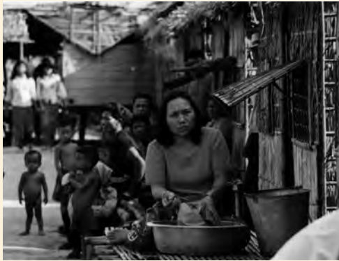
Rithy Panh. Site 2 , 1989