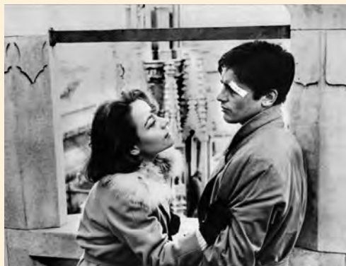
Luchino Visconti. Rocco y sus hermanos , 1960