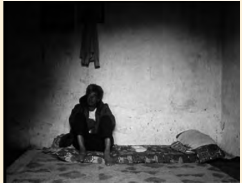
Amos Gitai. Wadi 1981-1991 , 1991