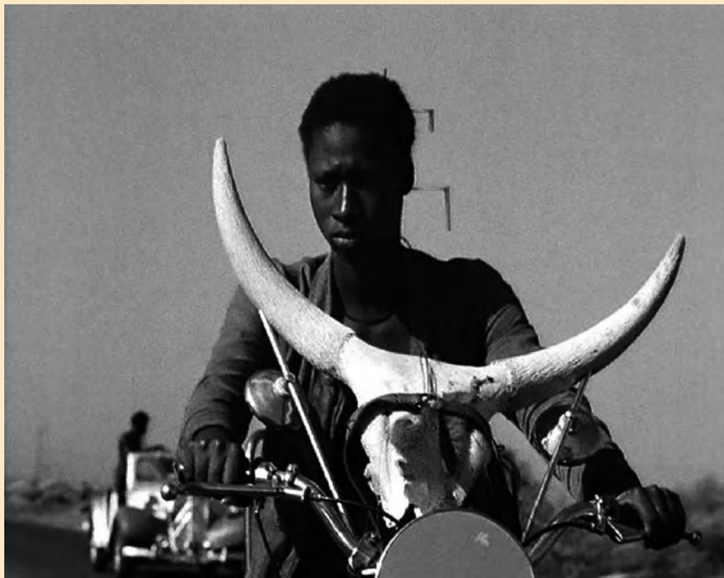
Djibril Diop Mambéty, Touki Bouki , 1973