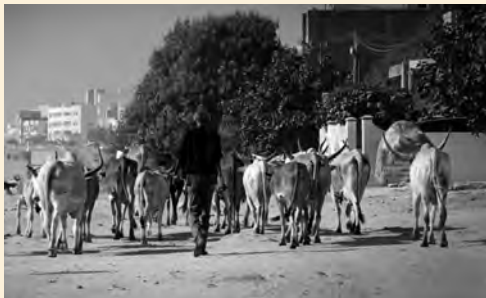
Mati Diop. Mille soleils . 2013

El cuarto invadido por la cámara es el refugio de Vanda, una joven drogadicta, en el interior de la casa familiar, en un barrio popular en demolición de Lisboa. El espacio se resume en una cama, en la que Vanda duerme, se amodorra o, sentada, charla con su hermana, recibe visitantes. La autodestrucción de la joven se corresponde con la destrucción del barrio en torno, Fontainhas. El film fue rodado en planos fijos que parecen resistir a la demolición. Pero esos planos son inestables, están sometidos tanto a los estremecimientos menores del personaje y del medioambiente como a los ruidos de destrucción procedentes del exterior. El presente resiste al borde de la catástrofe, en el umbral de la muerte.