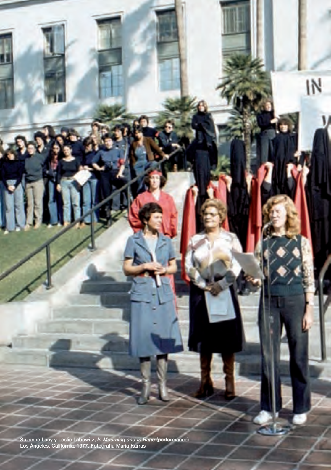
Suzanne Lacy y Leslie Labowitz, In Mourning and In Rage (performance) Los Ángeles, California, 1977.