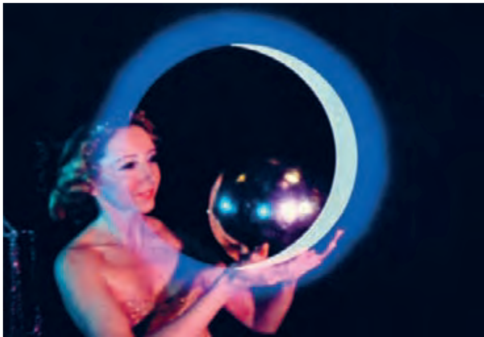
Kenneth Anger, Inauguration of the Pleasure Dome , 1954-66