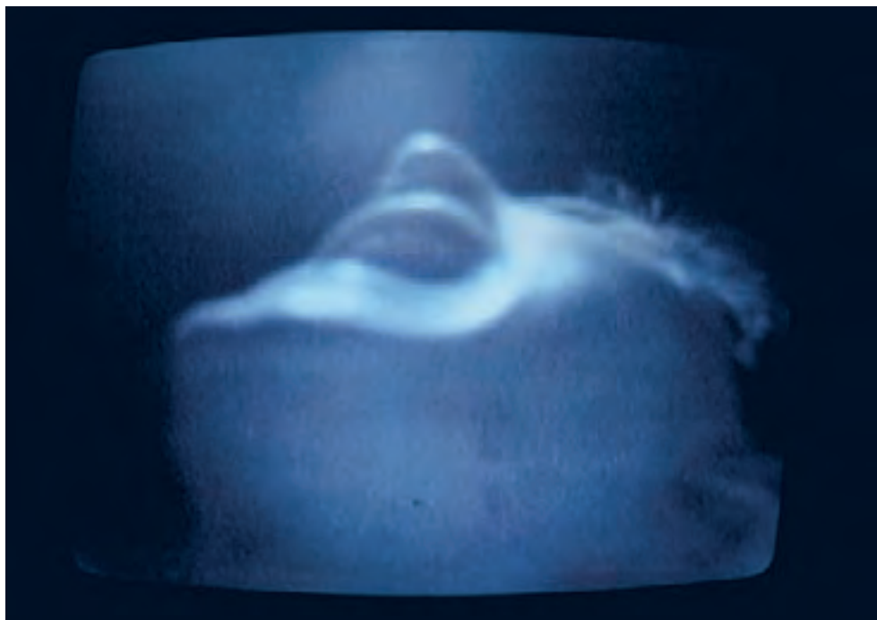
Ante Bozanich, Bands , 1977

Una hilarante adaptación de la legendaria performance de los