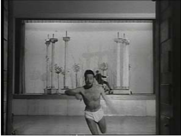
Mauricio Kagel. Hallelujah, 1969. 16 mm, b/n, sonido, 47'.

Mauricio Kagel. Match , 1966. 16 mm, b/n, sonido, 27'