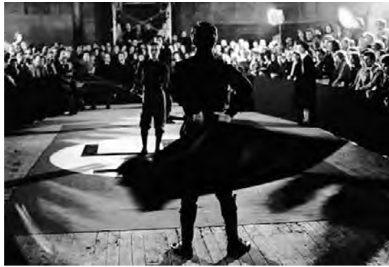
Che cos'è il fascismo

Suolo , 2008, vídeo, color, sonido, 14'50".