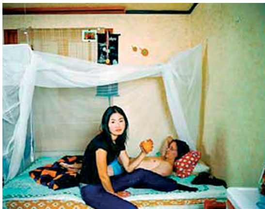
Oksun Kim, Happy Together , 2002