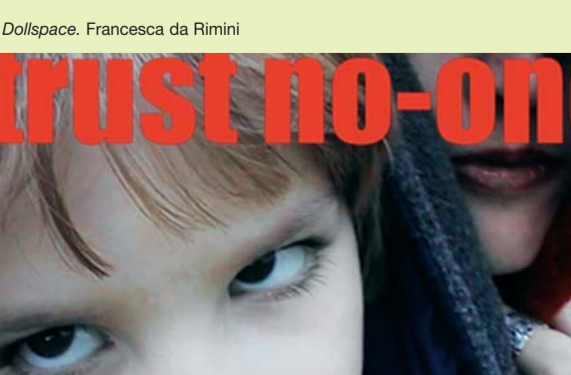
Dollspace. Francesca da Rimini

Faith Wilding y Hyla Willis, miembros de subRosa (http://www.cyberfeminism.net). Smart Mom, 1998-1999. http://www.andrew.cmu.edu/user/fwild/ Tina La Porta. voyeur_ web, 2001. http://artport.whitney.org/commissions/voyeurweb/ Cindy Gabriela Flores. El lugar de las mujeres en el Metro de la Ciudad de México, 2001. http://ciberfeminista.org/subway/ http://ciberfeminista.org/metro/ Guerrilla Girls. Guerrilla Girls (Website). http://www.guerrillagirls.com/ Cristina Buendía. No-pasatiempo, 2004. http://2-red.net/nopasatiempo/