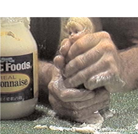
Cultural Soup. Paul McCarthy y Mike Kelley