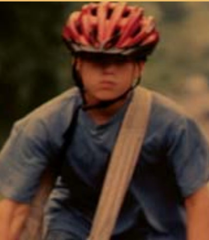
Paperboys, Mike Mills