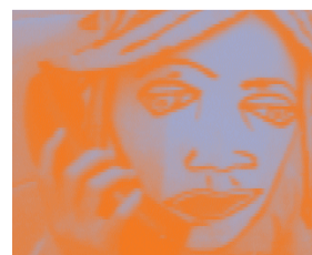
Flat is Beautiful