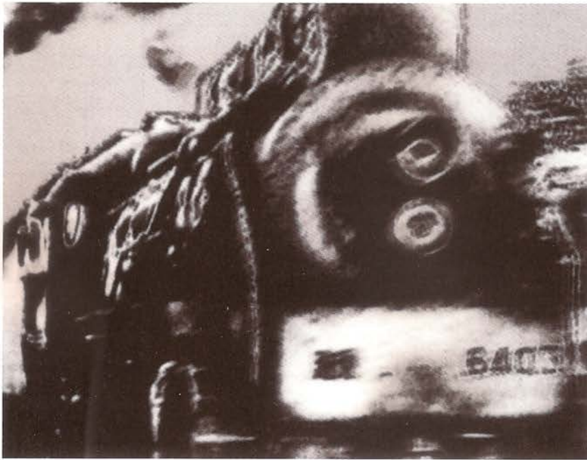
Siete visiones fugitivas, 1995.