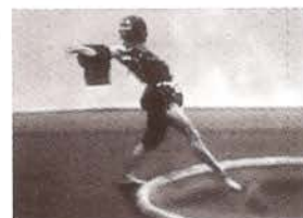
La danza del gavilán, 1979.