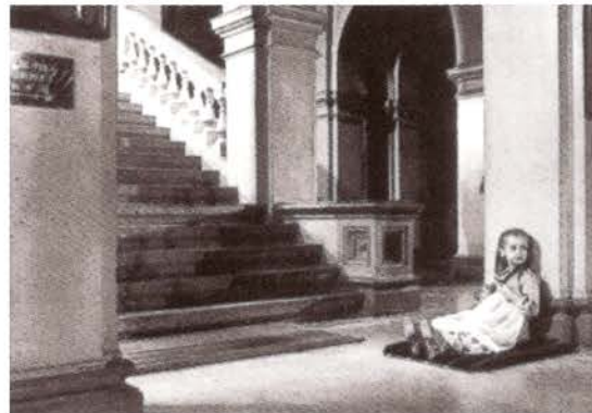
Arrêt sur marche , 1979.