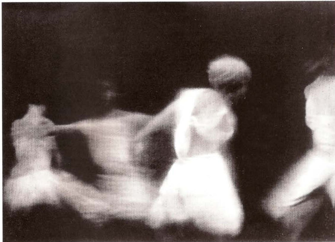
Parcela de cielo, 1987.