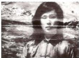
El segundo día, 1988.

Asociación y disociación de imágenes que siguen el ritmo discontinuo de la música de Zorn: una ciudad, Nueva York, que se mueve a toda velocidad, se ralentiza, se detiene, vuelve a arrancar... Osciloscopio, imágenes coloreadas, sobreimpresiones, aceleraciones y cámara lenta configuran un universo de contrastes y transiciones.