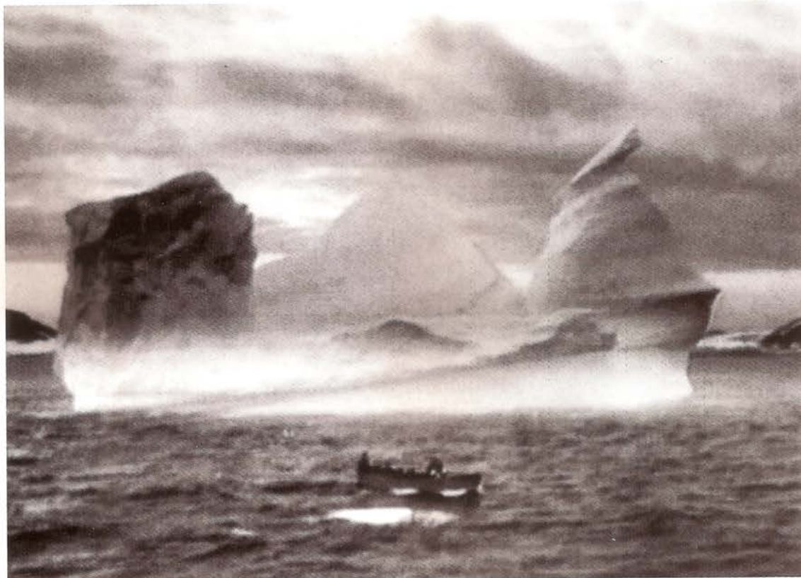
Viaje de invierno, 1993.