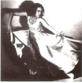
Mary Wigman, 1929.