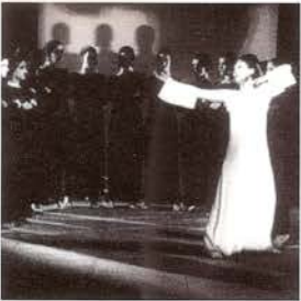
Martha Graham, 1929.