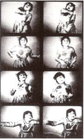
Valeska Gert, 1925.