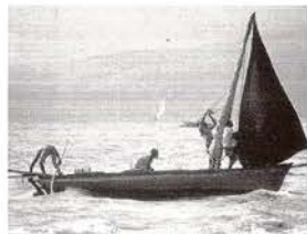
Querida Catherine, Raoul Peck, 1997

A la busca de una especie de patria, Raoul Peck ha reflexionado en los últimos diez años entre el cine y la política, entre una Europa más que saturada y un Haití hambriento. Le escribió a Catherine David una escueta carta. Se trata del balance, no sólo biográfico sino también político de un hombre que ha vivido en todos los mundos y que desea sólo lo mejor para su patria. ¿La lejana Europa o el cercano Haití? Su película es una reflexión sobre la patria, la dictadura y el pasado. Pero también sobre el tiempo y los medios de comunicación, la mirada y el olvido, el recuerdo y el dolor en lo personal, que también son arte y política.