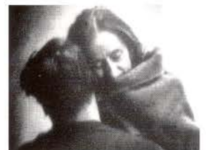
Madre e hijo Aleksandr Sokurov, 1997