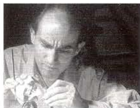
Naturaleza muerta, Harun Farocki, 1997

En su nueva película, Charles Burnett desarrolla una dura visión futurista de un Los Angeles empobrecido. Burnett cuenta la historia de Box Brown, el hombre del extraño nombre: "Cartón marrón". Su madre le llamó así en honor a un esclavo que tuvo el