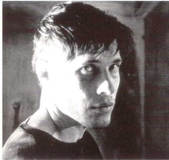
Madre e hijo , Aleksandr Sokurov, 1997

Rostov, Luanda. ¿Qué relaciona a estas dos ciudades? Son estaciones de una biografía. El joven director emprende la búsqueda... de la patria perdida. Nació en Mauritania y creció en Malí. Después de bachillerato, tuvo la oportunidad de estudiar cine en Moscú. Le enviaron un año entero a Rostov, al Don, para que aprendiera ruso. En el interminable viaje en