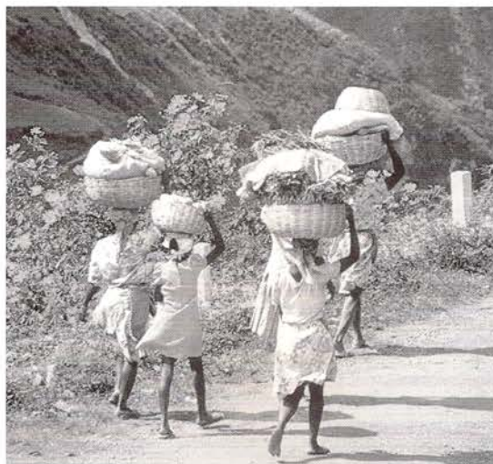
Querida Catherine, Raoul Peck, 1997