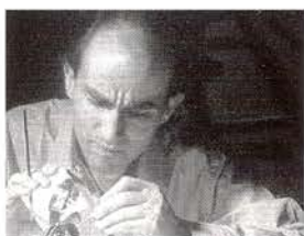
Naturaleza muerta, Harun Farocki, 1997

De igual manera que la pintura del siglo XVII retrataba objetos de la vida cotidiana (comidas, bebidas, ornamentos de mesa) en las Naturalezas Muertas, hoy día en la industria de la publicidad se realizan fotografías especializadas de los productos. Harun Farocki enlaza en su nueva película estos dos "mundos de la imagen". Ha visitado en sus estudios a fotógrafos de Francia, EE.UU. y Alemania, y, con su cámara, los ha observado trabajar durante días. "Es un placer observar a los fotógrafos de naturalezas muertas y a su equipo mientras trabajan, porque realizan un trabajo constructivo. Construyen una fotografía como si fuera un andamio o una grúa. La diferencia es que sabemos cómo será la grúa cuando esté terminada, mientras que los fotógrafos consiguen alcanzar su meta tras muchos intentos sucesivos, por fases, que han de materializar." (Harun Farocki sobre su película).