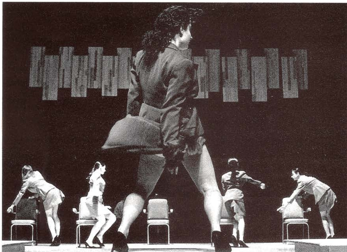
Achterland 1994. Coreografía y dirección: Anne Teresa de Keersmaeker. Compañía: Rosas. Música: György Ligeti & Eugène Ysaÿe.