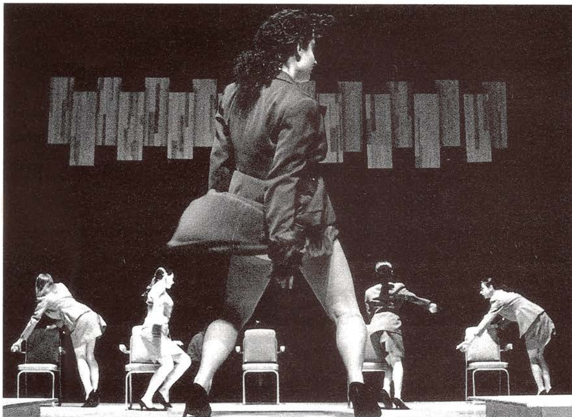
Achterland 1994. Coreografía y dirección: Anne Teresa de Keersmaeker. Compañía: Rosas. Música: György Ligeti & Eugène Ysaÿe.