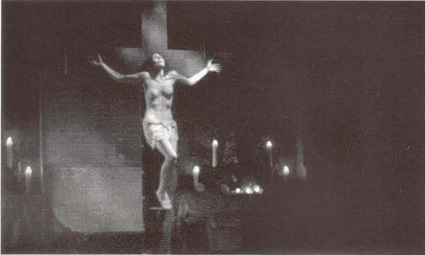
Strange Fisch. Coreografía de L.Loyd Newson. Dirección David Hinton.

El vídeo-danza ha estado vinculado históricamente, salvando raras excepciones, a las compañías de danza o a coreógrafos. Han sido ellos y ellas los principales impulsores de esta búsqueda de un nuevo "espacio" donde construir nuevas coreografías fuera del escenario. Este interés responde, en primer lugar, a motivaciones artísticas, pero también a la búsqueda de un mayor número de público, y a participar del poder de la TV.