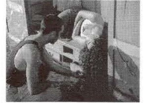
Peix. Dirección: Nuria Font y Angels Margarit. Coreografía: Angels Margarit.

Duración total del programa: 70 minutos.