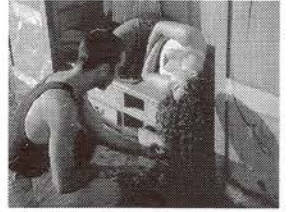
Peix. Dirección: Nuria Font y Angels Margarit. Coreografía: Angels Margarit.

Duración total del programa: 70 minutos.