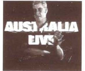
El bicentenario no será televisado. Space Collective, 1988