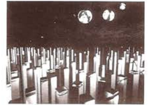
ENS Jon McCormack, 1990