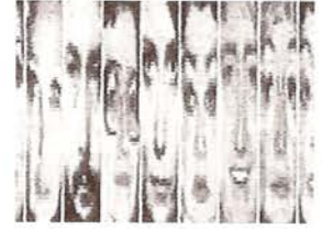
Ilustraciones Philip Brophy, 1986

Night's High Noon es un retrato de los recuerdos, sublimado en la construcción cultural de la identidad australiana contemporánea. Cada escena está construida por capas, para crear un paisaje de emblemas jugando con el llamado "paisaje informativo". En la cinta se produce un trabajo de referencias cruzadas entre la herencia lingüística y totémica de la cultura blanca y de la cultura aborígen en Australia.