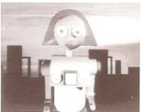
Robot Ciclo, Elena Popa. 1992