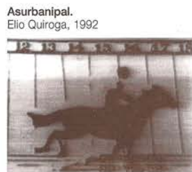
Asurbanipal. Elio Quiroga, 1992