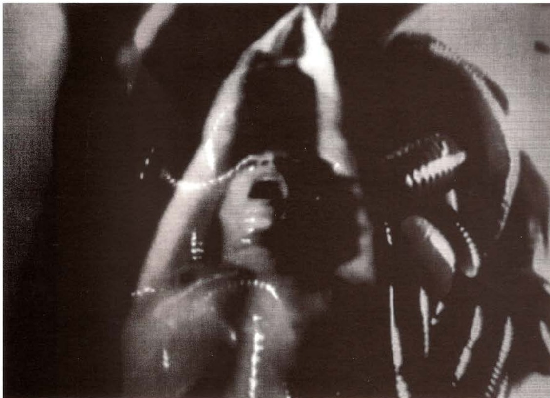
Tránsito. Ignacio Pardo, 1988

Fundació Antoni Tàpies, Barcelona. 26 septiembre / 27 octubre 1996.