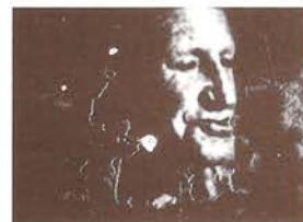
Señuelo. Jaume Subirana / Gringos, 1991