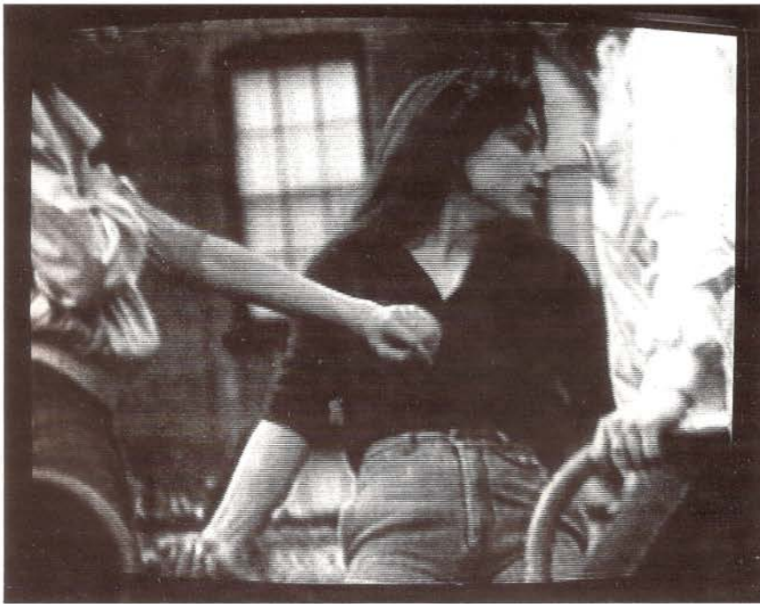
La maldición de Fausto: evocación Dara Birnbaum, 1983