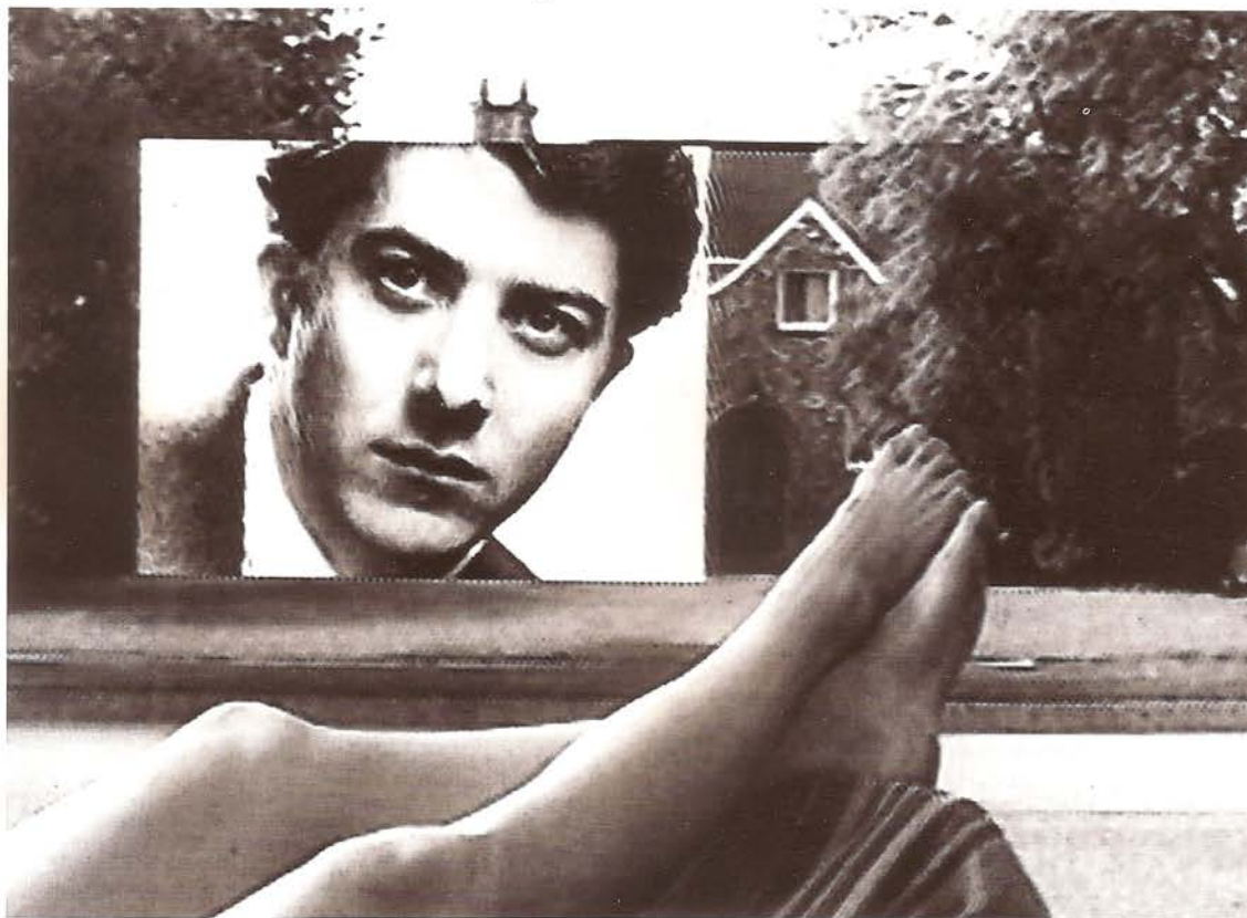
Porque veo televisión y otras historias, Ilene Segalove, 1983

El jueves 2 de febrero tendrá lugar la presentación del programa con una conferencia del crítico Manuel Palacios en el Salón de Actos a las 19 horas. Se proyectará una selección de los vídeos en exhibición.