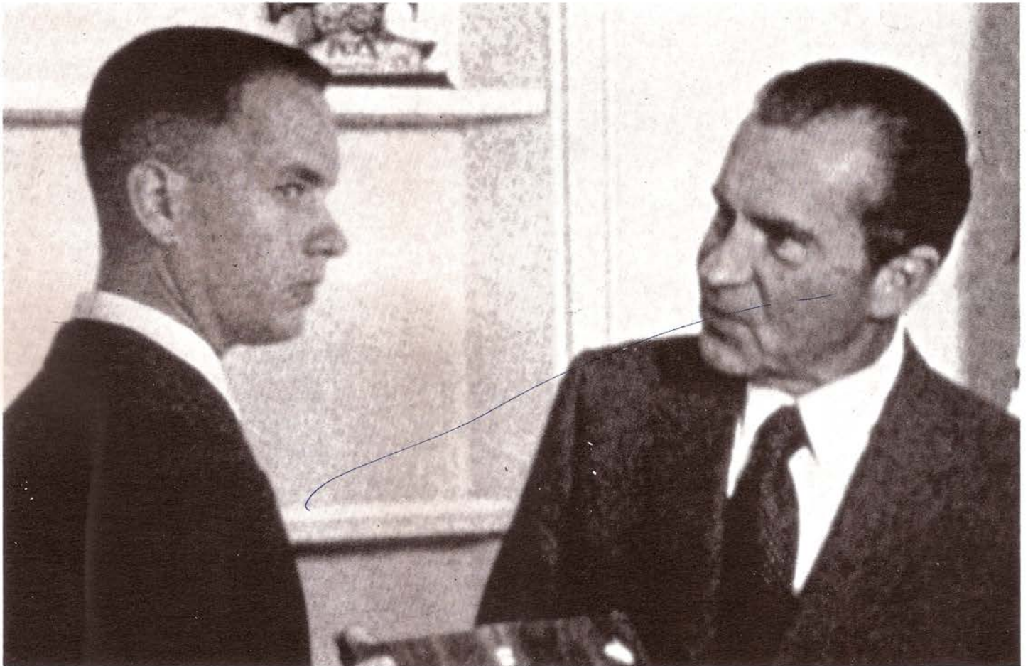
Industrial Light & Magic, Forrest Gump , 1994.