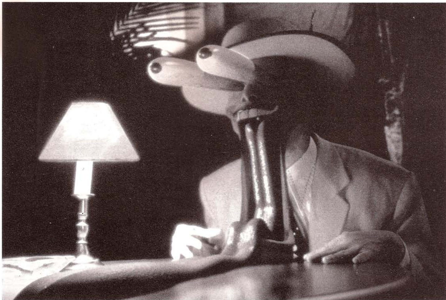
Industrial Light & Magic, The Mask , 1994.