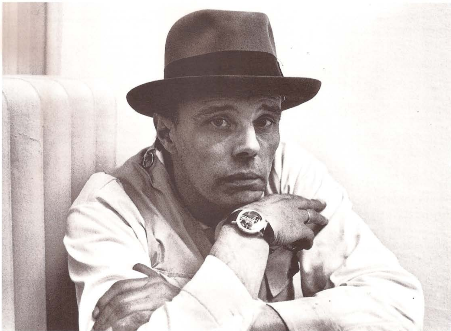
Joseph Beuys en la Kunsthalle de Berna 1969.