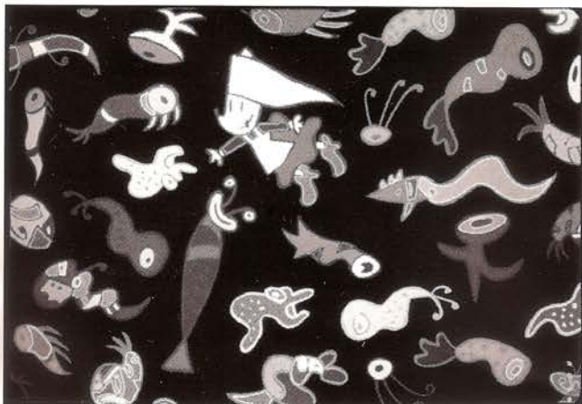
Mariscal, "Acuarinto", 1993 .