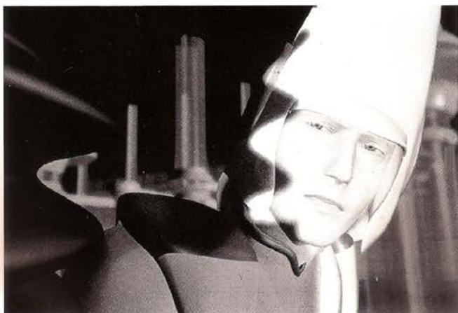
Moebius, "Starwatcher", 1993.

"Siempre hemos estado de camino hacia este nuevo lugar que en realidad no existe. Pero que es real"