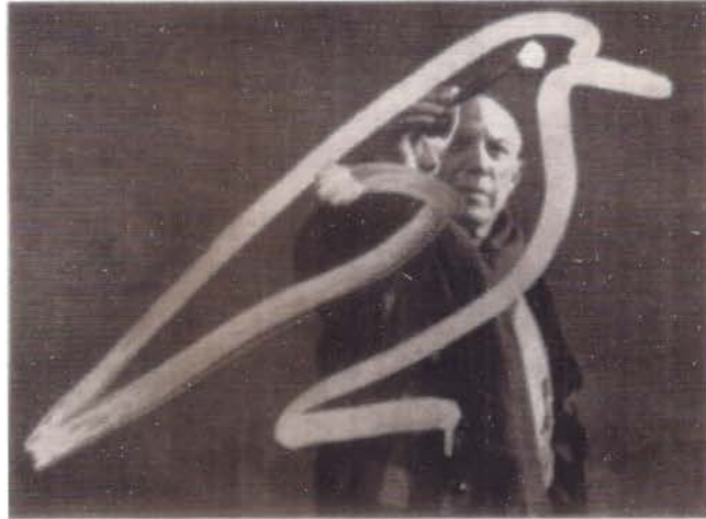
Visita a Picasso de Paul Haesaerts

No es posible imaginar tantas películas sobre un mismo artista, aún más difícil hacer su inventario, reajustar las fuentes, reelaborar las listas. Difícil creer que cada película ha sido realizada con la más natural sencillez, en una especie de incógnito cotidiano. Difícil creer que al buscar un poco más atrás en el tiempo, otros títulos aparecerían saliendo de celosos escondites y ocuparían su lugar, uno a uno, en esta larga lista. De las 192 películas catalogadas, 160 figuran en este índice y las 32 ausentes, lo son por falta de información o falta de detalles. Puestas una tras otra, representarían unas 140 horas de proyección, o sea aproximadamente unos 5 días y medio de programación continua, día y noche.