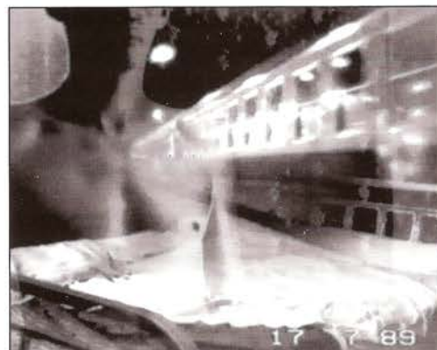
Journal , Jean-Luc Lagarce.

Jean-Luc Lagarce, director de teatro francés, lleva dos años grabando su universo íntimo con ayuda de una cámara de 8 mm. ¿Cómo hablar de sí mismo y del otro próximo con la cámara-tercer ojo, omnipresente y parcial, indiscreta y púdica, extraña y cómplice? ¿Qué es la intimidad? ¿Cuál es la relación posible entre la televisión y lo íntimo? ¿Entre lo real y lo íntimo? ¿Entre la ficción y lo íntimo?