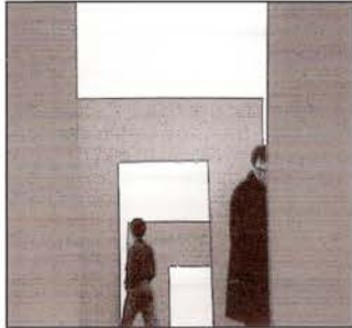
Reflexions, C. Chevrier, A. Jomier y X. Moehr.

(Reflexiones), de Colette Chevrier, Xavier Moehr y Alain Jomier .