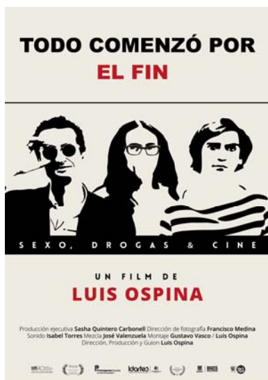
Poster de la película Todo comenzó por el fin (2015) de Luis Ospina

El Museo presenta una nueva edición del programa Intervalos , dedicado a películas recientes de cine de autor y experimental carentes de estreno o circulación, en el que proyecta la última y la primera obra del cineasta colombiano Luis Ospina (Santiago de Cali, Colombia, 1949), uno de los realizadores más incisivos y analíticos de la realidad colombiana. Su trabajo se encuentra ligado a la ciudad de Cali, uno de los centros artísticos alternativos más activos del país.