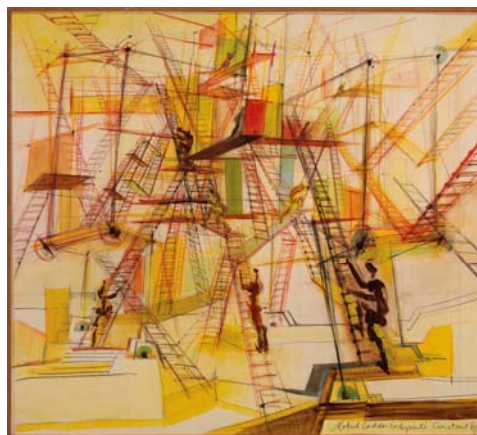
CONSTANT Mobiel Ladderlabyrinth , 1967 [Laberinto de escaleras móviles] - [Mobile Ladder Maze] Lápiz y pintura sobre papel 109,2 x 101,4 cm Gemeentemuseum Den Haag