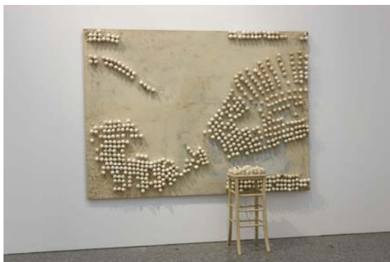
MARCEL BROODTHAERS Tableau et tabouret avec œufs (Panel y taburete con huevos). 1966 Lienzo pintado y taburete de madera pintado con cáscaras de huevos Lienzo: 258.5 x 187.6 x 7 cm Taburete: 91.5 x 45 x 35 cm Museo Nacional Centro de Arte Reina Sofía, Madrid

Más de 200 obras –en su mayoría dibujos en tinta y grafito, fotos, acuarelas así como un número reducido de óleos en lienzo y collages- muestran la evolución de su obra desde finales de los años 50 hasta principios de los 80, haciendo especial hincapié en el trabajo desarrollado durante los años 70. Nasreen Mohamedi permanecerá abierta al público desde el 18 de marzo hasta el 5 de junio de este año.