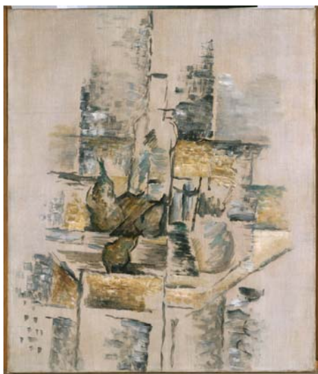
GEORGES BRAQUE Bouteille et fruits (Botella y frutas) , 1911 Óleo sobre lienzo 64,5 x 54,2 cm Museo Nacional Centro de Arte Reina Sofía

Ahora, fruto de este acuerdo de colaboración, el público puede contemplar en las salas 207, 208 y 210 del edificio Sabatini del Museo Reina Sofía una selección de más de 70 obras procedentes de los fondos cubistas de las colecciones de la Fundación Telefónica y del Museo Reina Sofía que ponen de manifiesto la gran pluralidad de propuestas creativas que generó esta corriente artística y que dan pie a una lectura más amplia sobre ella.