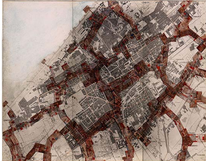
CONSTANT Nueva Babilonia / La Haya, 1964 Acuarela sobre papel sobre tablero aglomerado 220 x 279,9 cm GEMEENTEMUSEUM DEN HAAG