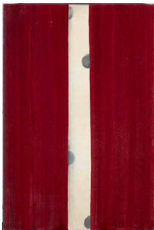
JUAN USLÉ Amapola, 1991

La selección de obras se ha realizado atendiendo a dos discursos diferentes: Punto de encuentro , aborda los conceptos de espacio y geometría y reúne 70 obras de 14 artistas, todos españoles. Partiendo de los autores más clásicos, referentes en la colección de Soledad Lorenzo, como Palazuelo y Tàpies , se propone un recorrido por obras en distintos formatos de reconocidos artistas, como Soledad Sevilla , o el denominado Grupo Vasco ( Badiola , Irazu , Prego o Euba , entre otros). Todos ellos trabajan el concepto espacial desde múltiples ópticas. En el recorrido también estará presente la obra de la escultora Ángeles Marco –artífice también de la renovación de la escultura española- Guillermo Pérez Villalta , Perejaume , Juan Uslé , José María Sicilia o Victoria Civera .