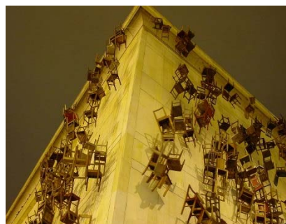
DORIS SALCEDO Noviembre 6 y 7, 2002

Palimpsesto , nombre con el que titula su proyecto, hace referencia a todas aquellas personas que han fallecido ahogadas en el Mediterráneo y el Atlántico durante los últimos veinte años tratando de emigrar de sus pueblos de origen con la esperanza de una vida mejor y con mayores libertades. Sobre losas realizadas con una compleja ingeniería hidráulica, la pieza escribe con gotas de agua, y de manera temporal e intermitente, algunos de los nombres de hombres y mujeres que han muerto en estas circunstancias de huida.