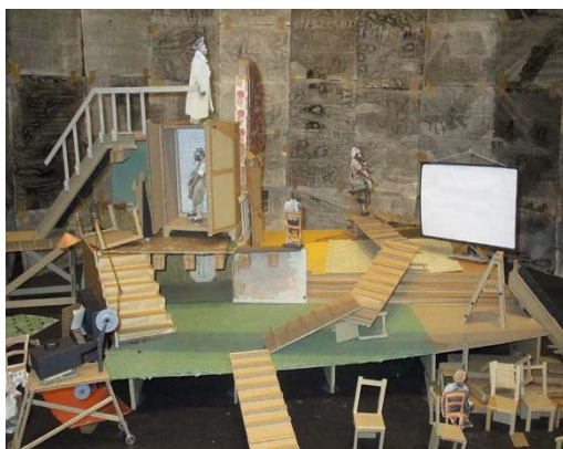
WILLIAM KENTRIDGE Maqueta para la ópera Wozzeck , 2016

El 31 de octubre se inaugura la muestra de William Kentridge (Johannesburgo, 1955), artista recientemente galardonado con el Premio Princesa de Asturias de las Artes 2017 . Desde los años noventa ha combinado la práctica del dibujo con el cine y el teatro, convirtiéndose en un artista multidisciplinar que ha cultivado, además, la escenografía, el collage , el grabado, la escultura y el videoarte. A partir de 2003, Kentridge comenzó a interesarse por la escultura y la videoinstalación y a incluir referencias al teatro, la ópera y el cine en sus nuevos trabajos.