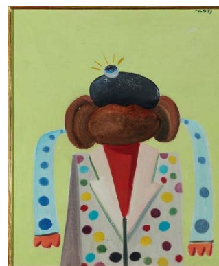
GEORGE CONDO Sin título, 1993