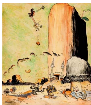
GEORGE HERRIMAN Krazy Kat , fecha desconocida

El 17 de octubre arranca la exposición dedicada a George Herriman (EE. UU., 1880-1944), considerado como uno de los más importantes creadores del cómic estadounidense. Perteneciente a una generación de pioneros que desarrollaron su trabajo al amparo de los periódicos que comenzaron a incluir tiras de cómic en sus páginas atraídos por ese nuevo medio, el creador de la popular tira Krazy Kat (1913-1944) ejerció una gran influencia entre un amplio número de artistas como Willem de Kooning u Öyvind Fahlström , así como en intelectuales y escritores tales como E. E. Cummings , T. S. Eliot o Jack Kerouac .