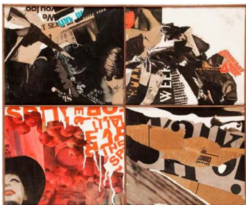
Pandora 4 visages , 1965-66