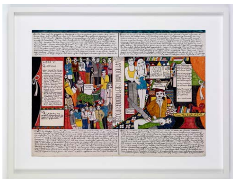
Danger In Düsseldorf , 1973/1994

Collage, pointe feutre et encre sur Bristol, cadre bois et verre