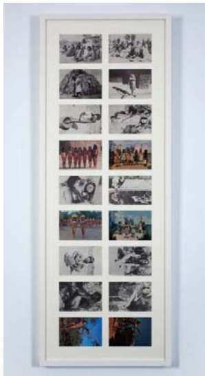
Brasil nativo, Brasil Alienígena , 1976-1977