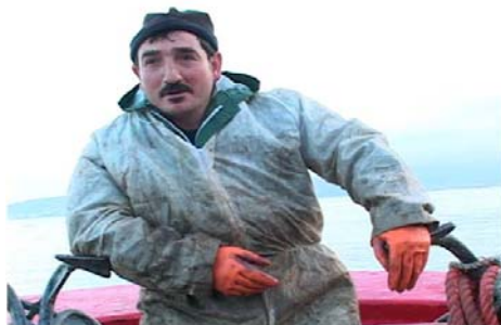
The Lottery of the Sea , 2006

Cine en formato digital (color, sonido, inglés, español, gallego con subtítulos en inglés) Duración: 170'