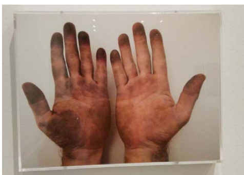
Mis manos después de tocar cosas sucias, 2015

Impresión digital sobre papel fotográfico 22 x 27 cm