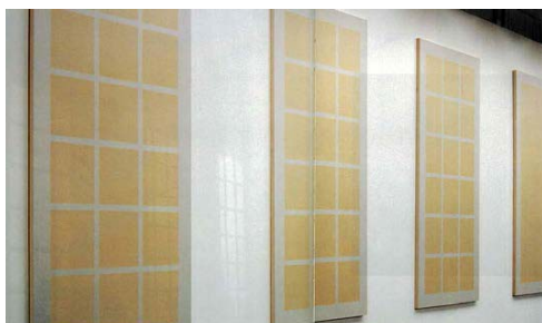
Llum (sis finestres). Luz (Seis ventanas), 1993

Impresión digital sobre papel fotográfico 22 x 27 cm