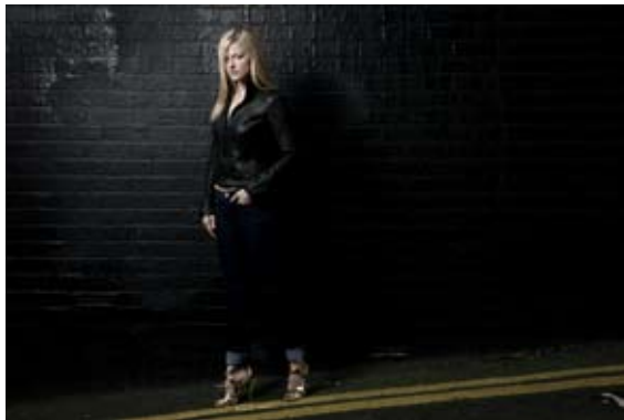
Mary Anne Hobbs