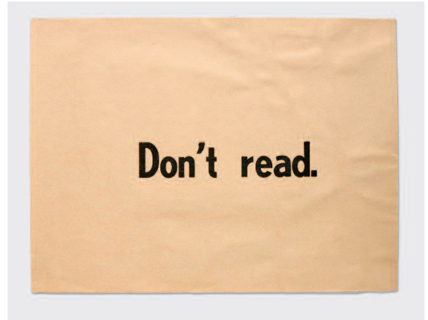
Dear reader. Don't read. (díptico, 2/2), 1975. Colección particular, París

También encontramos las claves de su obra en trabajos como el libro de artista Tras la poesía (1973), la película The Death of the Art Dealer (1982) o el vídeo TV-Tonight (1987). De su participación en la red de arte correo durante su período más creativo surgieron, entre otros frutos, la revista Ephemer (1977-1978), dedicada a la recepción diaria de las obras que circulaban a través de esa red. Para Ulises Carrión, el arte postal era una suerte de estrategia de guerrilla. Con independencia de que se use el sistema de correos como soporte - igual que se usa el lienzo, el papel o la madera - o como medio de distribución, tanto "arte" como "correo" confluyen para controlar la producción y la