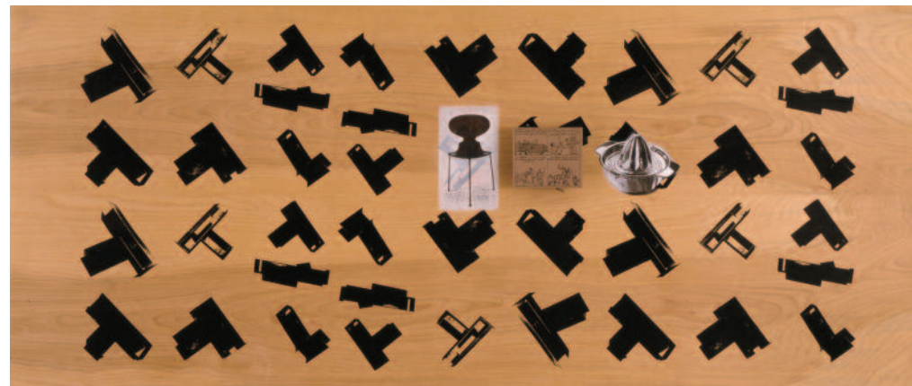
MD 4, 1990 © Txomin Badiola, VEGAP, Madrid, 2016

Un aspecto a tener en cuenta a la hora de aproximarnos al trabajo de Txomin Badiola es que, con frecuencia, los espacios de sus obras son, a la vez, interiores y exteriores, pues al entrar en ellos el espectador se puede sentir, simultáneamente, dentro y fuera. En cierto sentido esto conecta con la idea de “espacio negativo” de Oteiza, pero a diferencia del escultor guipuzcoano, no piensa subtractivamente; su planteamiento es, más bien, aditivo. Frente a lo que podríamos describir como una posición de ortodoxia modernista, la de Oteiza, basada en la premisa de que “menos es más”, la posición de la que parte Badiola sería posmoderna, acumulativa. No obstante, el punto de llegada en ambos casos es parecido, pues con su acumulación de signos, de referentes, lo que busca es un vacío o fuga de la expresión (“más es menos”) con el que quiere evitar que todo se cierre sobre una sola cosa, posibilitando así que el espacio permanezca dinámicamente tenso. Txomin Badiola asume entonces la condición “bastarda” de investigar las paradojas y contradicciones de una modernidad en ciernes, oponiéndose al contexto ideológico dominante de una versión de la posmodernidad que tendía a exterminarla. La “mala interpretación” y la “mala forma” serán los principios operativos de una estrategia de resistencia y subversión, a través de los cuales reexaminará en su obra y en sus escritos la relación entre lo local y lo global, entre forma y concepto, entre el arte y la vida.