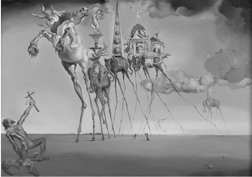
La tentación de San Antonio, 1946. Óleo sobre lienzo. 89,5 x 119,5 cm. Musées royaux des Beaux-Arts de Belgique.

Dalí. Todas las sugerencias poéticas y todas las posibilidades plásticas