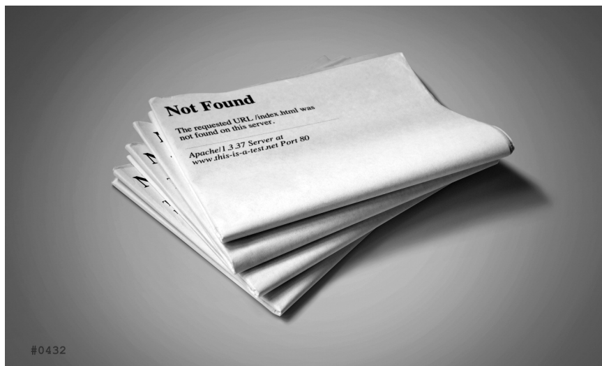
Daniel G. Andújar, Not Found , 1000 casos de estudio, 2014

Artista visual, teórico y activista, Daniel G. Andújar (Almoradí, Alicante, 1966) utiliza medios digitales, estrategias del mundo empresarial e intervenciones en el espacio público en una variada producción artística que bascula entre el territorio de lo real (la ciudad) y las herramientas de lo virtual (la Red). La conexión entre ambas delata cómo las relaciones sociales y de poder participan de un estado de negociación en permanente redefinición, que pone de manifiesto las desigualdades y debates que generan tales relaciones en el mundo actual. La exposición Sistema operativo está compuesta por una selección de obras de nueva producción junto a diversos trabajos anteriores, formando un corpus que revela las constantes de su discurso creativo y crítico.