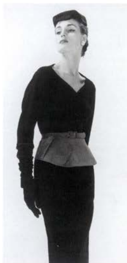
Vestido forro negro de punto con cinturón/bolsillo de 1954

La magia de Pertegaz Dedicar más de setenta años al desarrollo de un oficio es un talento no siempre al alcance de todos. Máxime en un mundo tan efímero como el de la moda. Esa ha sido una de las maestrías de Manuel Pertegaz, artista de la moda y protagonista de esta exposición-homenaje. Su disciplina, su constancia y, sobre todo, su alegría y entereza en el trabajo, así lo merecían. • Desde que a los trece años y en una sastrería de Barcelona descubrió su capacidad para dar belleza a la silueta femenina, Pertegaz no ha dejado de abrir salones de moda; organizar desfiles en Nueva York, Berlín, Venecia, Londres, Barcelona y Madrid; recibir honores nacionales e internacionales o disfrutar con los éxitos de sus clientas,