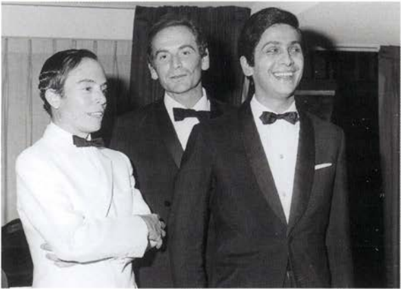
Con Pierre Cardin y Valentino en México, 1962