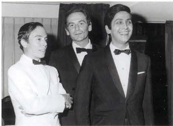
Con Pierre Cardin y Valentino en México, 1962