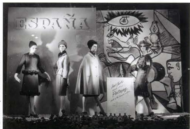
Escaparate de Bergdorf Goodman en Nueva York, 1964