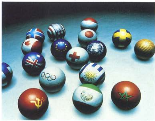
Genérico Expo 92, Videocamino, 1990.

do, autores más ampliamente documentados en el programa de proyecciones de la Sala 2; la imagen de síntesis , con cuadros de Sempere e Yturralde que incorporaron la generación electrónica de imágenes en su proceso creativo; un espacio dedicado a «Menina», de Juan Carlos Eguillor; la explicación del proceso de fabricación de imágenes sintéticas; la evolución en la creación en imagen de síntesis, con imágenes que reflejan aportaciones históricas, el nacimiento de importantes productoras y las creaciones de independientes, en algunos casos usuarios de sistemas domésticos.