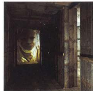
«El reformatorio (falsos gemelos)», Francisco Ruiz de Infante, 1992.

Creí que podría construir un reformatorio como si fuera una cabaña, una escuela o una casa. Al final sólo he podido hacer un túnel y dos extraños vagones para hablar de una deportación irreversible.