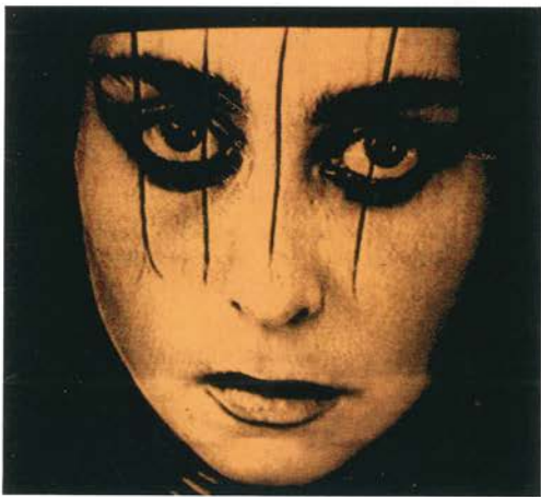
Veneno puro, Xavier Villaverde, 1984.

tación de Claudio Guerín frente a una instalación, «Telenostalgias», que muestra imágenes emblemáticas de las primeras emisiones conservadas de TVE; se exhiben programas que han aportado innovaciones sustanciales en la praxis televisiva española; se refleja la interesante y densa realidad de la imagen corporativa de nuestras emisoras de televisión; el video de creación , con la propuesta «Video de creación en España: 20 años, 12 autores», exhibición en sala de una pieza de cada autor selecciona-