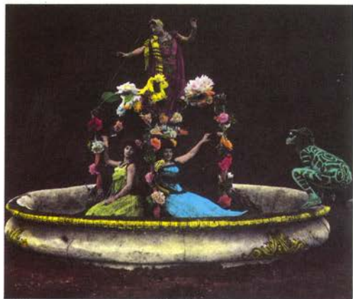
Fotograma coloreado mecánicamente por Segundo de Chomón (probablemente La Légende de la Soie , 1909).

La Bienal de la Imagen en Movimiento '92 se estructura en torno a dos principales ejes de actividad: la exposición y el programa de proyecciones. La exposición recorre el cinema ,