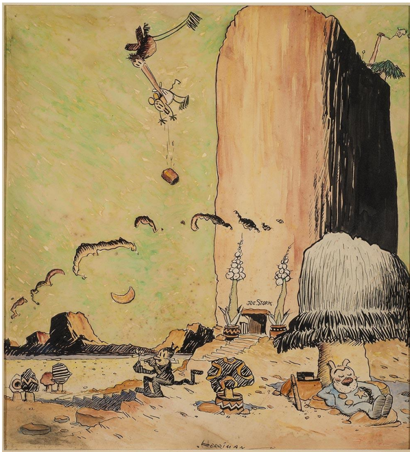
GEORGE HERRIMAN Krazy Kat, S.f.