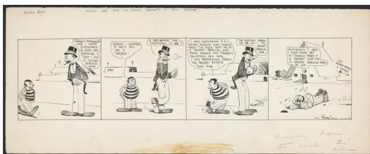
GEORGE HERRIMAN Baron Bean Dibujo original para tira de periódico. 1918

A la vez que publicaba Krazy Kat George Herriman siguió experimentando, simultáneamente, con otras creaciones cómicas, todas ellas centradas en personajes humanos. Un aristócrata gorrón era la estrella de Baron