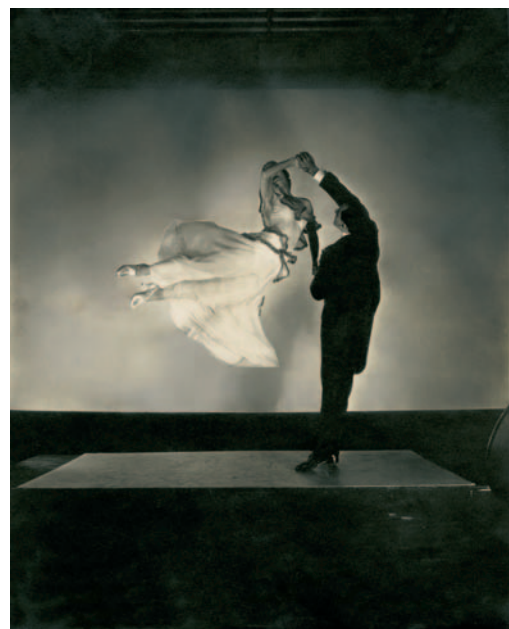
Antonio de Marco and Renée de Marco, The renowned ballroom dancing team, 1935 (Antonio de Marco y Renée de Marco, la célebre pareja de baile de salón)

En los años veinte, Steichen renunció al ideal del «arte por el arte» que había caracterizado su obra más temprana y declaró que la fotografía debía aspirar a ser algo más que «papel tapiz de gran calidad» para coleccionistas ricos. Aplicando sus habilidades en el ámbito comercial, se convirtió en figura pionera de la fotografía publicitaria moderna, al tiempo que revolucionó la fotografía de