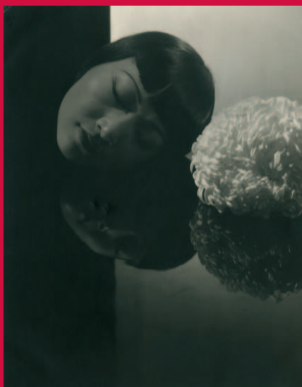
Anna May Wong , 1930

25 de junio de 2008 - 22 de septiembre de 2008