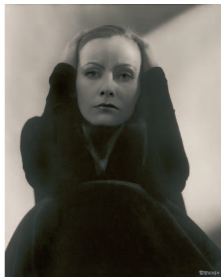
Greta Garbo, 1928

“Coincidiendo con esta gran retrospectiva dedicada a Steichen, en el Museo del Traje (Madrid) tiene lugar la exposición Edward Steichen, fotografía de moda (Los años de Condé Nast, 1923-1937) , desde el 25 de junio al 21 de septiembre de 2008”